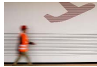
BER-Debakel Flughafen BER verzichtet auf Dienste von mehreren hundert Planern